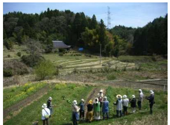
春の恵み 野草摘み