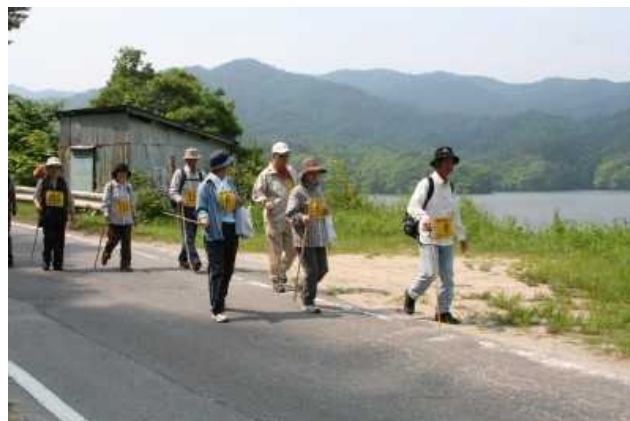
三河湖ウォークラリー 昨年の様子